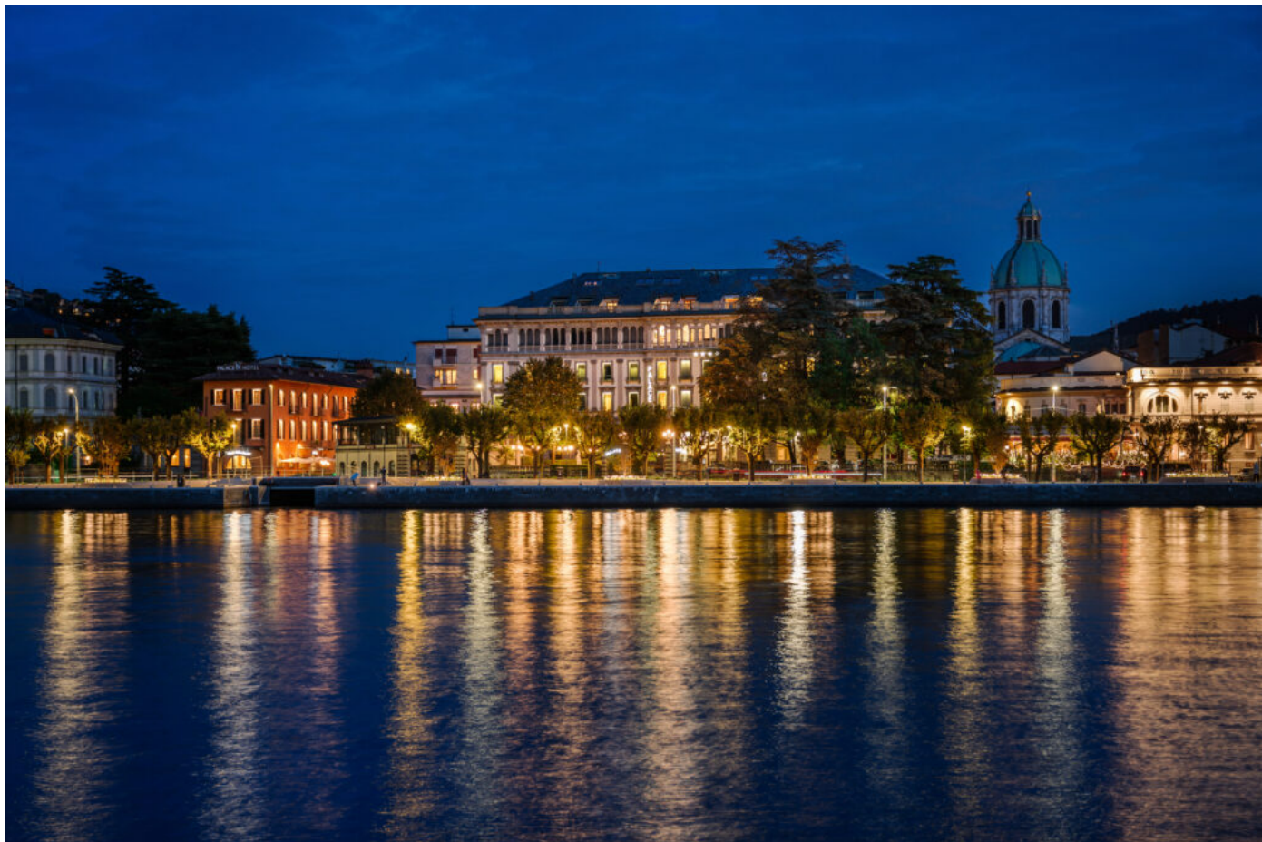
Palace Hotel Como

Info: +39 06 3231144 o scrivere a info@palazzoripetta.com