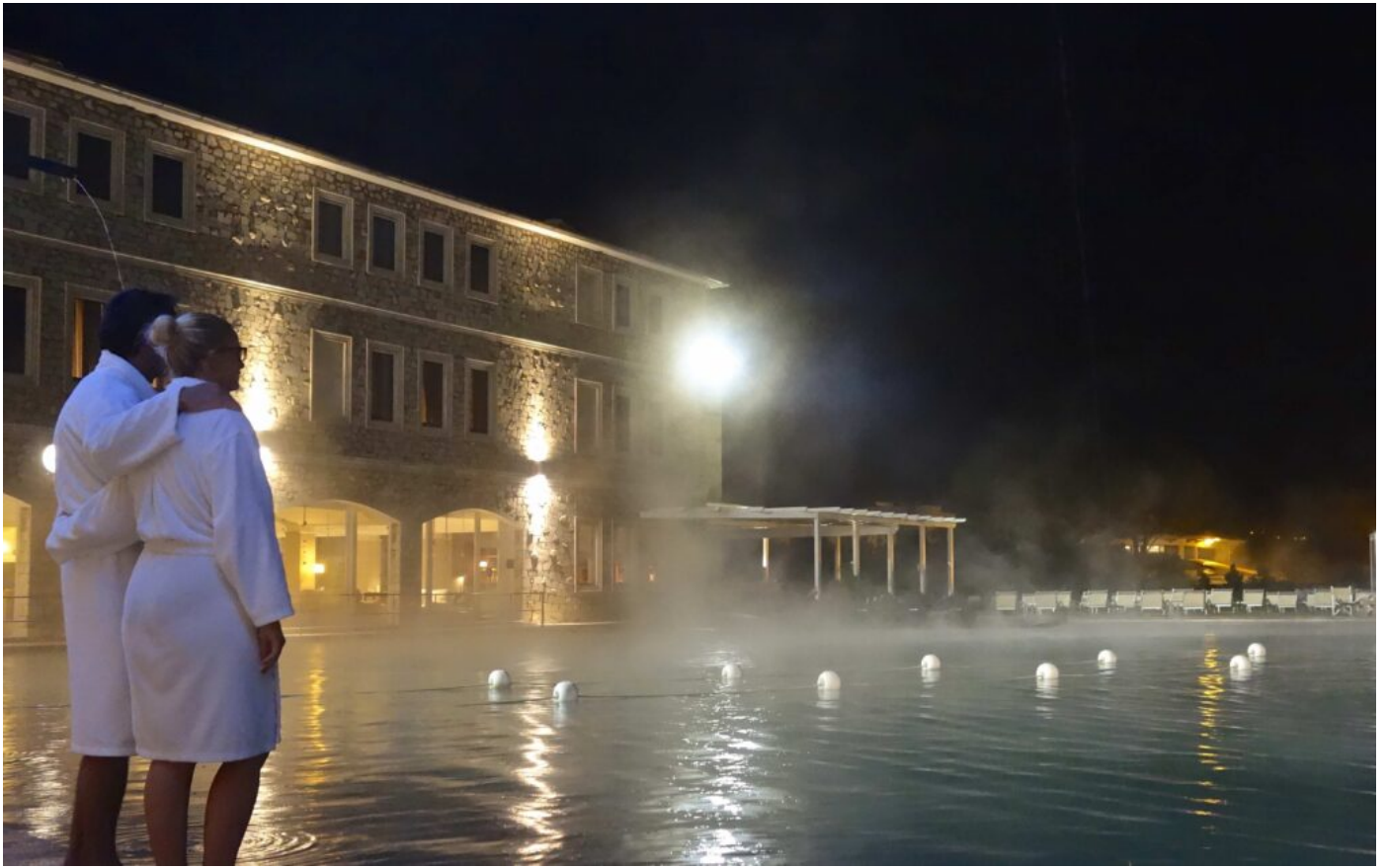
Terme di Saturnia