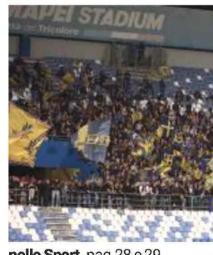
nello Sport pag.28 e 29