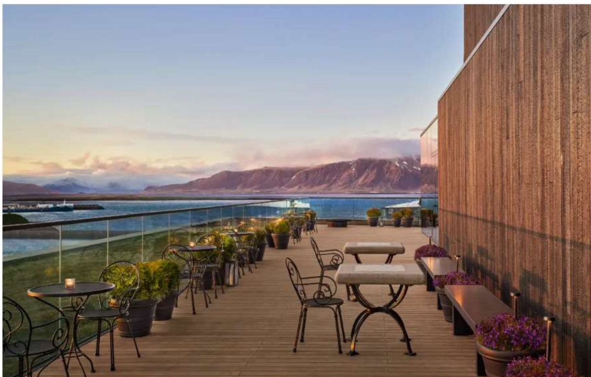
The Roof, The Reykjavik EDITION.

Dal The Roof del The Reykjavik EDITION lo sguardo spazia a 360° sull'oceano, sul monte Esja e sul ghiacciaio Snæfellsjökul. Siamo al 7° piano dell'hotel, dove luminose vetrate a tutta altezza si aprono sull'ampia terrazza esterna. È una location unica nella capitale islandese: affacciato sul porto, è il posto d'eccezione a Reykjavik per godersi le infinite e luminose serate estive, perfetto anche per ammirare l'aurora boreale nei mesi più freddi, sullo sfondo dell'iconica catena montuosa della capitale. Da prenotare un posto in prima fila durante le celebrazioni della Notte della Cultura e il Capodanno, il cielo di Harbor all'esterno dell'hotel si infiamma di fuochi d'artificio.