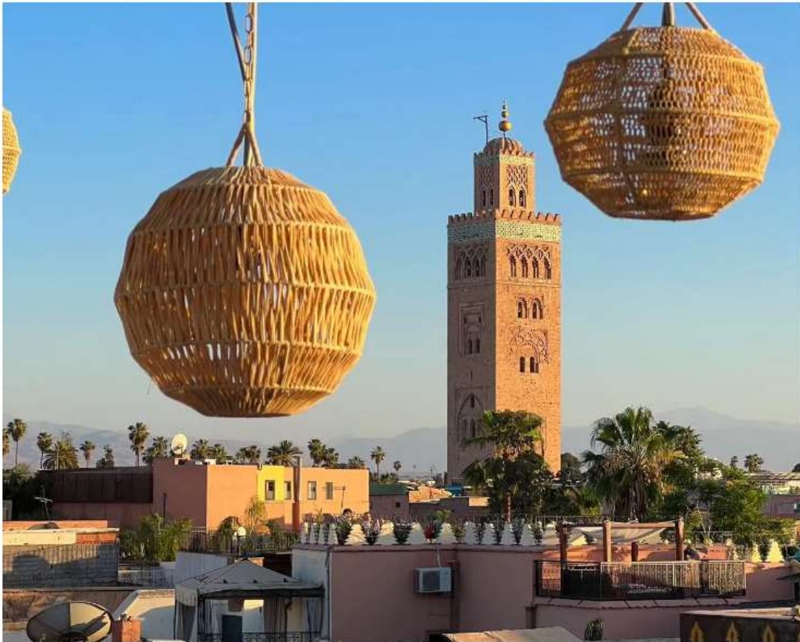
Rooftop MK di Maison MK a Marrakech