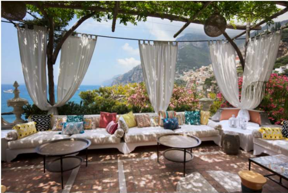
Villa Treville 2018