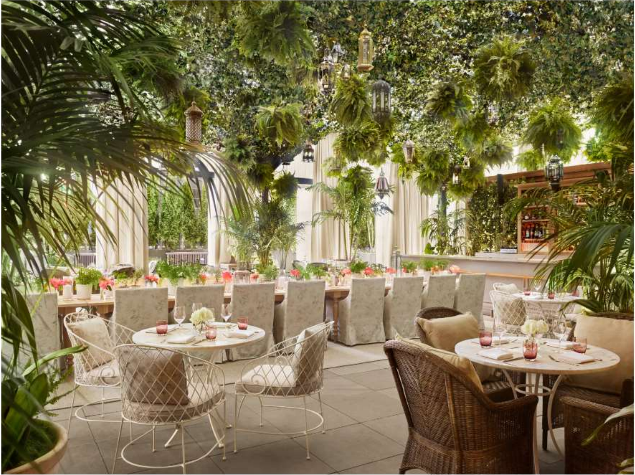
The Terrace and Outdoor Gardens at The Times Square EDITION, New York