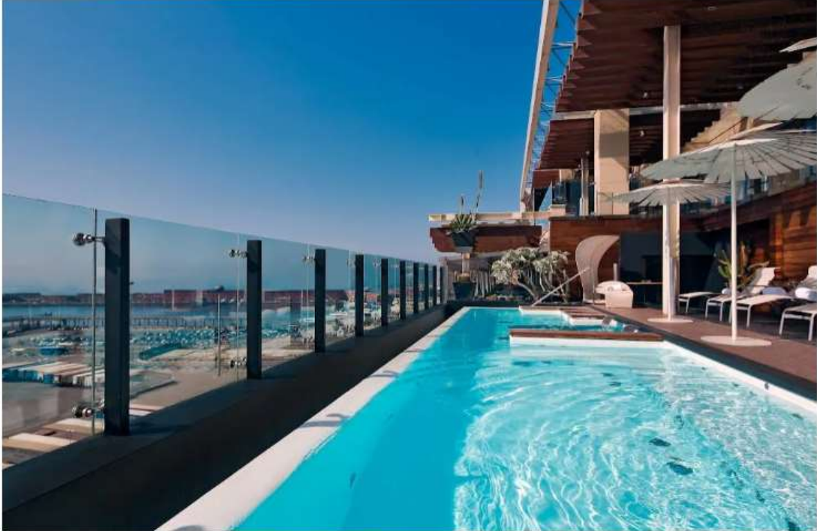
Il rooftop con piscina del ROMEIO Hotel di Napoli

Progettato dal famoso studio giapponese Kenzo Tange & Associates , il ROMEIO Hotel è la sintesi perfetta tra design, arte contemporanea, preziosi oggetti di antiquariato e installazioni d'arte. Una struttura interamente di cristallo che culmina al nono piano con il rooftop con piscina panoramica , che regala un'impareggiabile vista sul Golfo, dove è possibile rilassarsi e godersi i colori cangianti della luce al tramonto ordinando un cocktail o un flûte di Champagne.