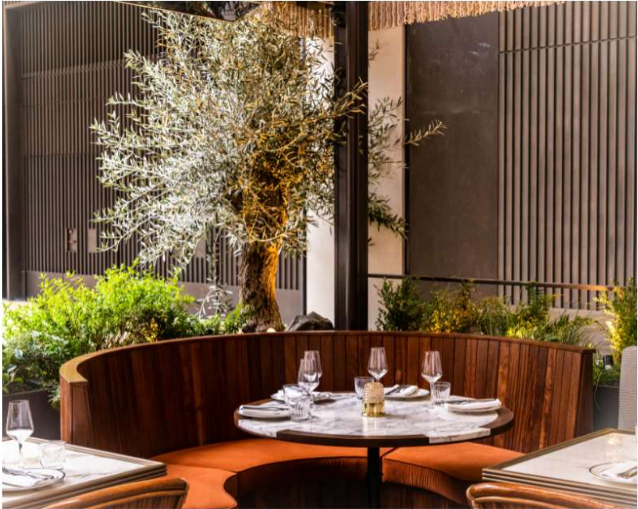
The Terrace, MAINE Mayfair, Londra