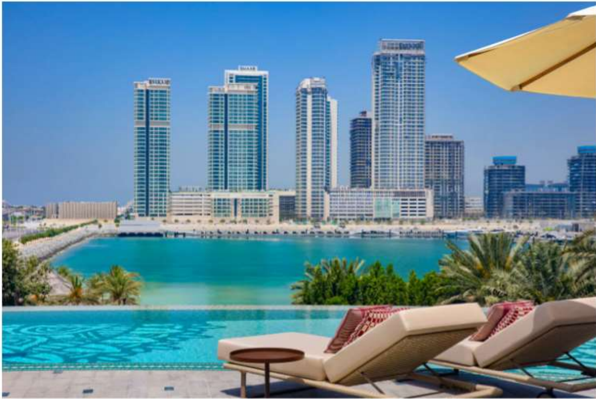
L'Infinity Pool del W Dubai - Mina Seyahi