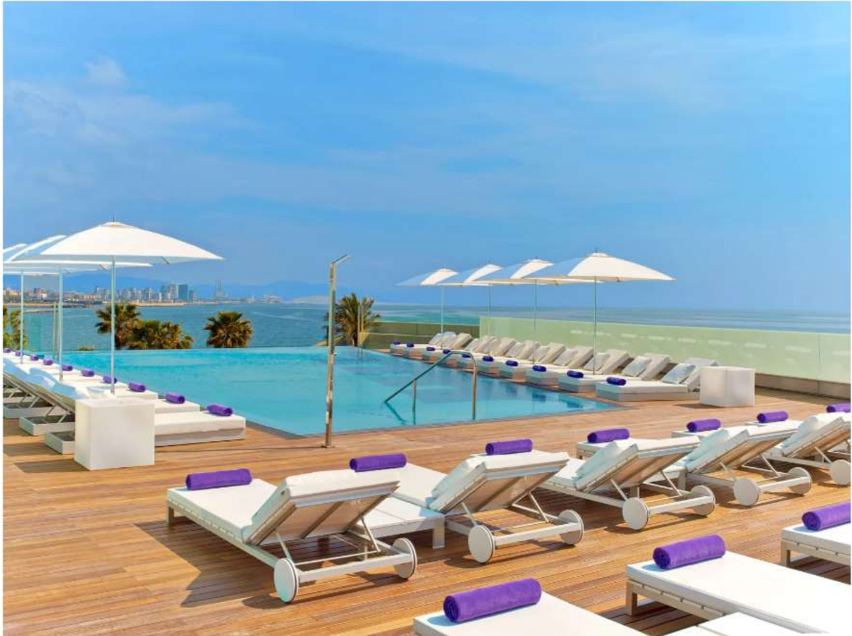
Il SUN Deck del W Barcelona Eric Laignel

Accanto alla spiaggia di Barceloneta, il W Barcelona , svetta tra gli edifici del centro storico con la sua caratteristica forma di vela. Due le piscine all'aperto che, benché non all'ultimo piano, consentono di spaziare con la vista sull'oceano e sullo skyline: dalla piscina a sfioro SUN Deck si ha la sensazione di nuotare nel Mediterraneo, mentre dalla WET Pool and Terrace , al primo piano, si ammirano il litorale e sugli edifici della città di Gaudì. Per l'aperitivo, in drink list tanti signature cocktail e tapas d'autore.