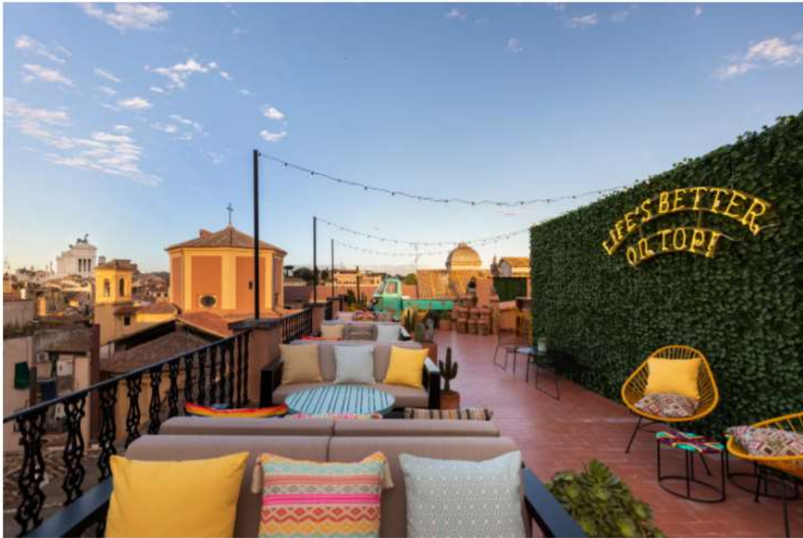
L'Hey Güey, il rooftop in stile messicano del Chapter Rome