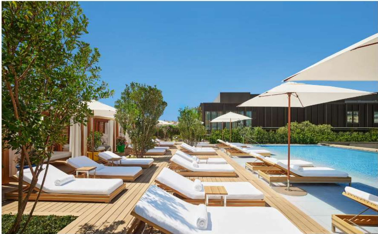
The Madrid EDITION Rooftop & Terrace, Madrid