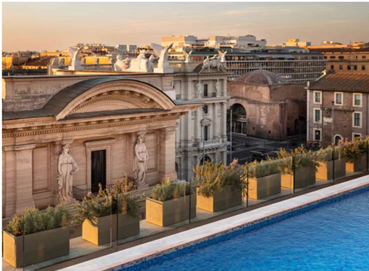
La piscina della terrazza dell'Anantara Palazzo Naiadi di Roma, dove la cucina è firmata SEEN by Oliver

Nel centro di Roma, in Piazza della Repubblica, l' Anantara Palazzo Naiadi Rome Hotel ospita una delle più grandi terrazze panoramiche della capitale, con tanto di piscina, riaperta al pubblico, dopo un imponente lavoro di ristrutturazione, in una nuova ed elegantissima veste. dopo Lisbona, San Paolo e Bangkok, lo Chef Olivier da Costa approda con il suo brand a Roma. L'esperienza gastronomica è firmata SEEN by Oliver , che offre specialità brasiliane, tipicità italiane e sushi, in un ambiente raffinato. Immerso nello splendore dell'antica Roma, oggi inserito nel circuito dei The Leading Hotels of the World , l'edificio sorge sulle antiche Terme di Diocleziano, le cui fondamenta, piscine e mosaici sono visibili dal piano inferiore attraverso luminosi pavimenti in cristallo.