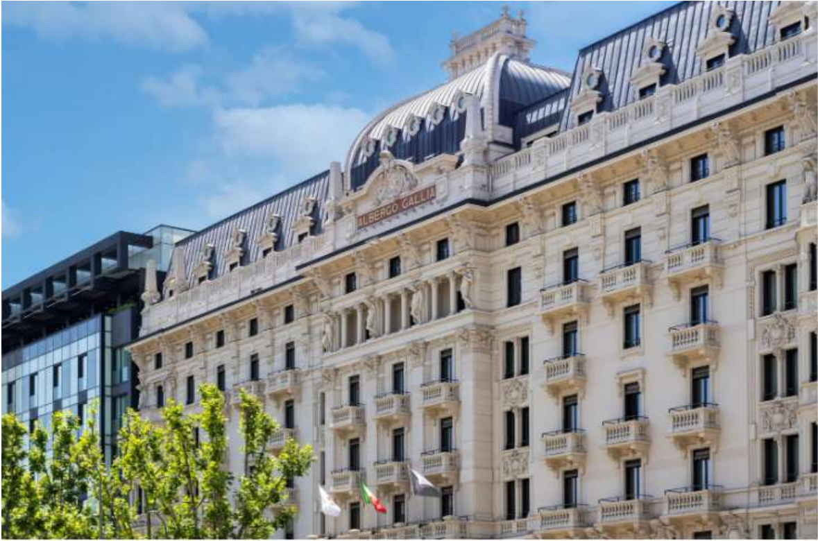
La facciata dell' Excelsior Hotel Gallia , a Luxury Collection Hotel