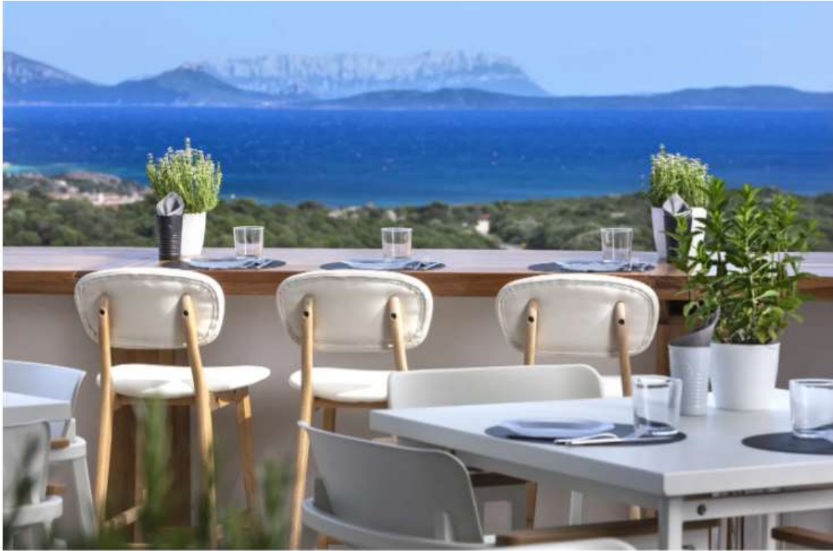
Terrazza Frades guarda sulla spettacolare baia di Cala di Volpe, in Costa Smeralda