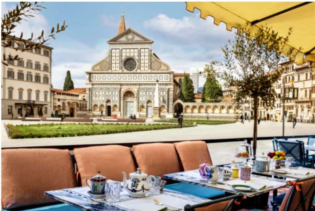
The Terrace del The Place, la terrazza urbana più grande di Firenze

Guarda su su Piazza Santa Maria Novella The Terrace del The Place , la terrazza urbana più grande di Firenze, Punto di osservazione privilegiato, è aperto dalla mattina alla sera, per la prima colazione, pranzi cene e aperitivi. L'hotel è parte della collezione The Hospitality Experience , neonato progetto di alta ospitalità in Italia (insieme al Londra Palace Venezia e Borgo dei Conti Resort, ora in ristrutturazione).