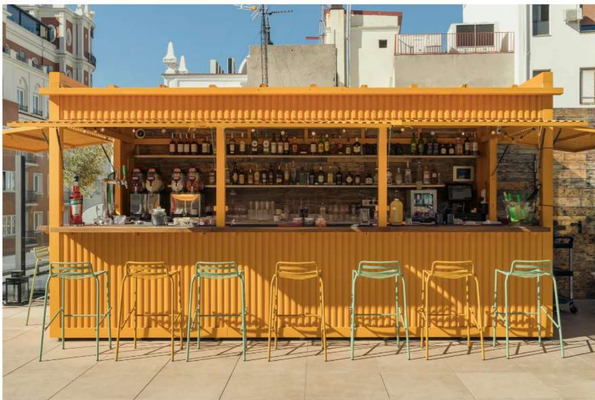
La Terreza, generator, Madrid

Per chi vuole immergersi nella capitale spagnola senza spendere troppo, l'indirizzo ideale è Generator , in uno degli ostelli di design in più rapida crescita in Europa. Situato in prossimità di Grand Via, nel centro di Madrid, gli ospiti hanno l'imbarazzo della scelta tra le migliori offerte della città. Ci si accomoda al bar sul tetto, La Terreza , recentemente rinnovato, per ordinare un cocktail al sole o scendere al piano inferiore per mangiare un boccone nel ristorante, aperto fino a tardi tutti i giorni.