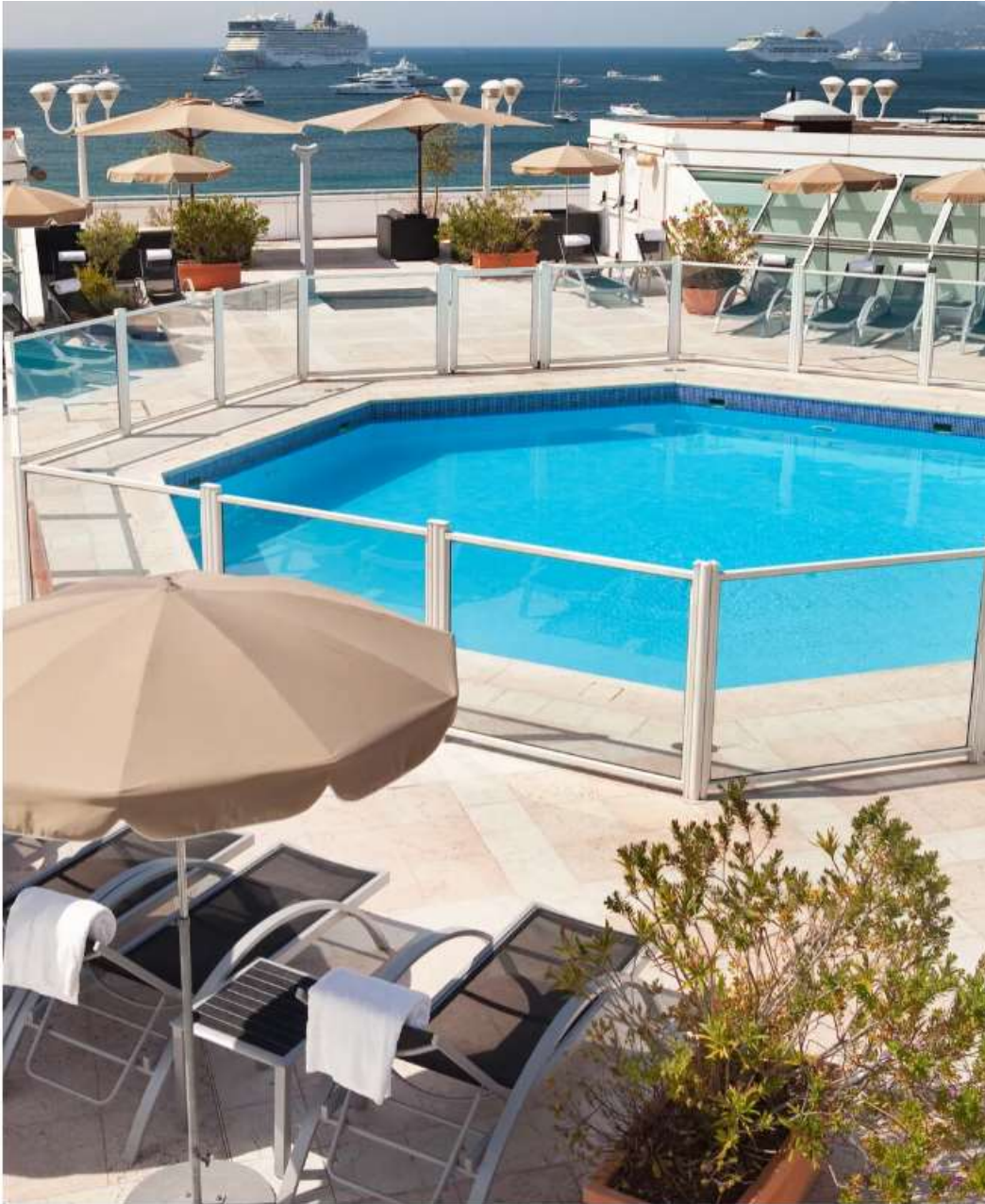
La Rooftop pool del JW Marriott Cannes