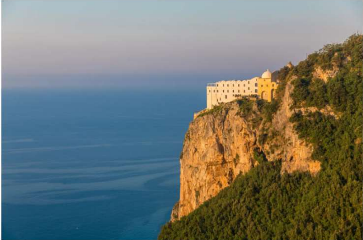
La strepitosa vista dalla terrazza del Tramonto del Monastero Santa Rosa Hotel & Spa - Maurice Naragon