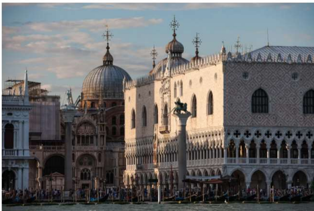
Dalla terrazza dell'Aman Venice si gode una vista a 360° sulla Serenissima