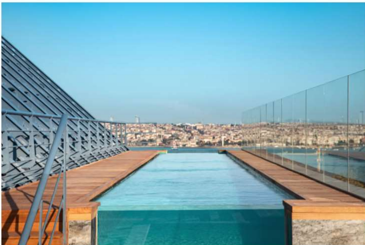
L'Infinity Pool del The Ritz-Carlton di Istanbul

In posizione privilegiata dell'hotel nel cuore della città, The Ritz-Carlton, Istanbul è il luogo ideale per chi desidera vivere la capitale like a local . All'ultimo piano, è un polo d'attrazione la terrazza The Roof con l'iconica Infinity Pool , la piscina a sfioro da cui osservare il Bosforo e tutta Istanbul, concedendosi una nuotata rivitalizzante e poi ordinando i signature cocktail del Bar a bordo piscina.