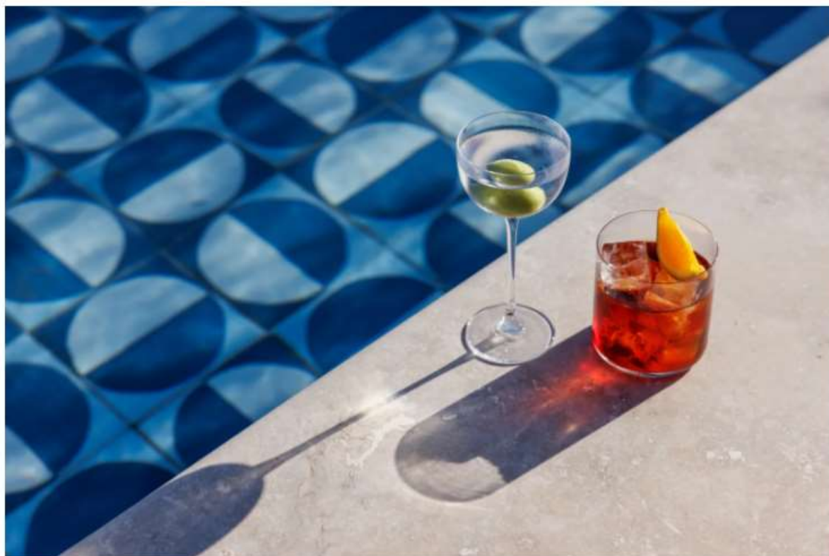
Scorcio della Wet Deck sui tetti del W Rome, immancabile in ogni hotel W