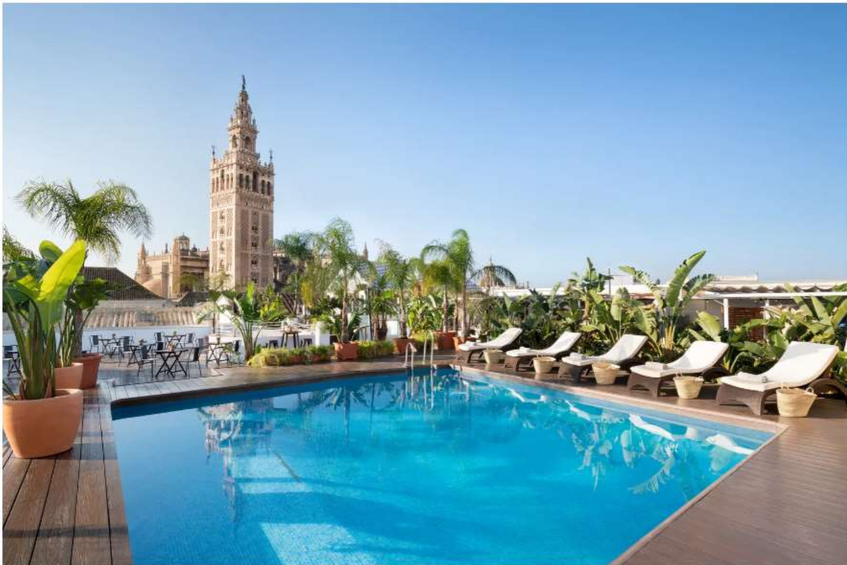
Il Pool Club del Los Seises Sevilla, a Tribute Portfolio Hotel a Siviglia