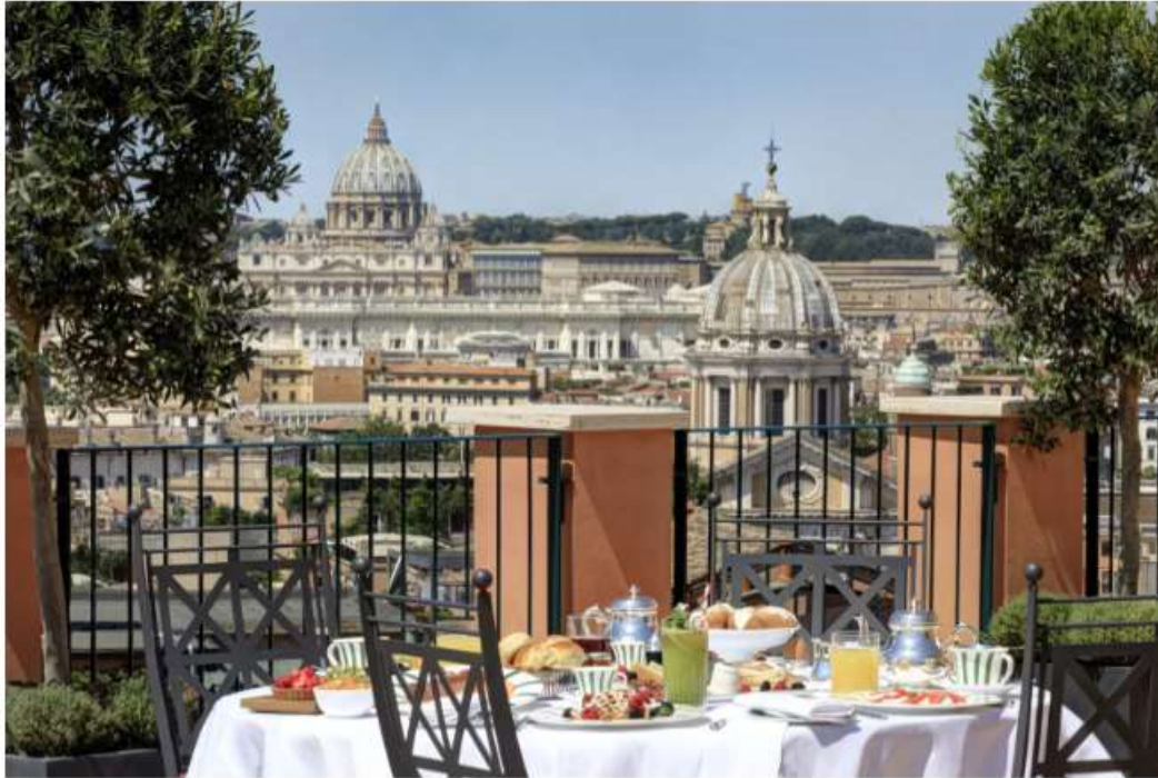
La terrazza dell'Hotel de la Ville a Roma.