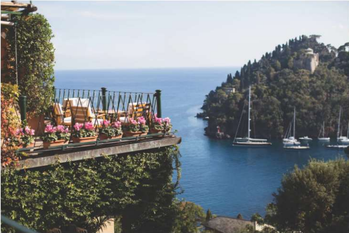
La scenografica terrazza dello Splendido, a Belmond Hotel, di Portofino

L'iconico Splendido, A Belmond Hotel , arroccato sul monte di Portofino, dove l'anima sofisticata del borgo s'intreccia con la sua storia antica, vanta un'ampia terrazza incorniciata dal glicine e una vista sull'intramontabile e scintillante sul golfo. È un punto di vista d'osservazione privilegiato, solo da qui si possono scorgere alcuni dettagli della leggendaria Piazzetta e oltre. Al tramonto, l'invito è sorseggiare aperitivo del posto, rilassarsi e ammirare il cielo.