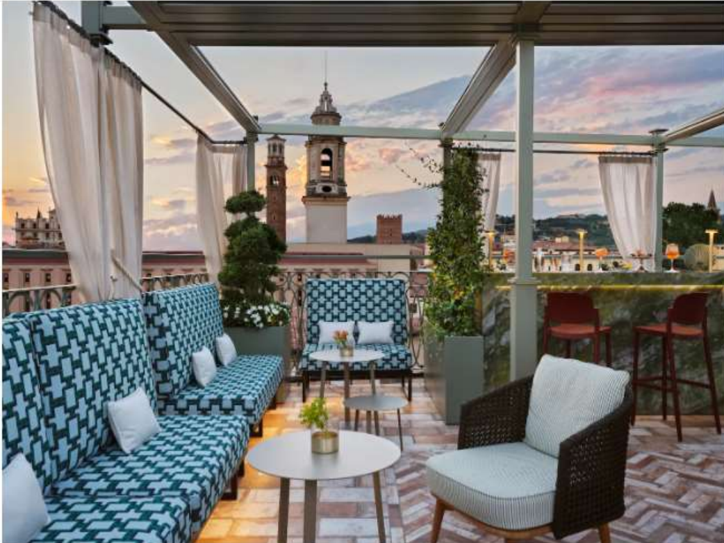
L'Infinity Bar di VISTA Palazzo a Verona