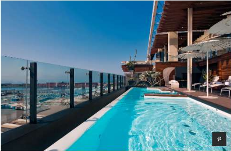
Grand Hotel Parker's, Napoli