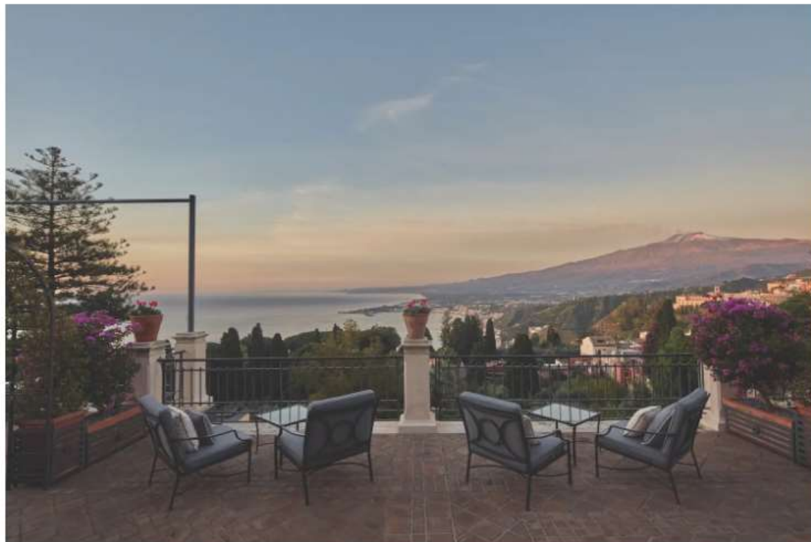
La Terrazza del Grand Hotel Timeo, A Belmond Hotel, Taormina Tyso Sadlo

È senza dubbio il panorama migliore di Taormina, lo stesso che ha ispirato il pittore Otto Geleng: dalla leggendaria terrazza del Grand Hotel Timeo, A Belmond Hotel , lo sguardo resta rapito dall'Etna e dallo Ionio. Basta sedersi sulla terrazza e sorseggiare un cocktail per immergersi nella splendida vista della costa con l'Etna all'orizzonte.