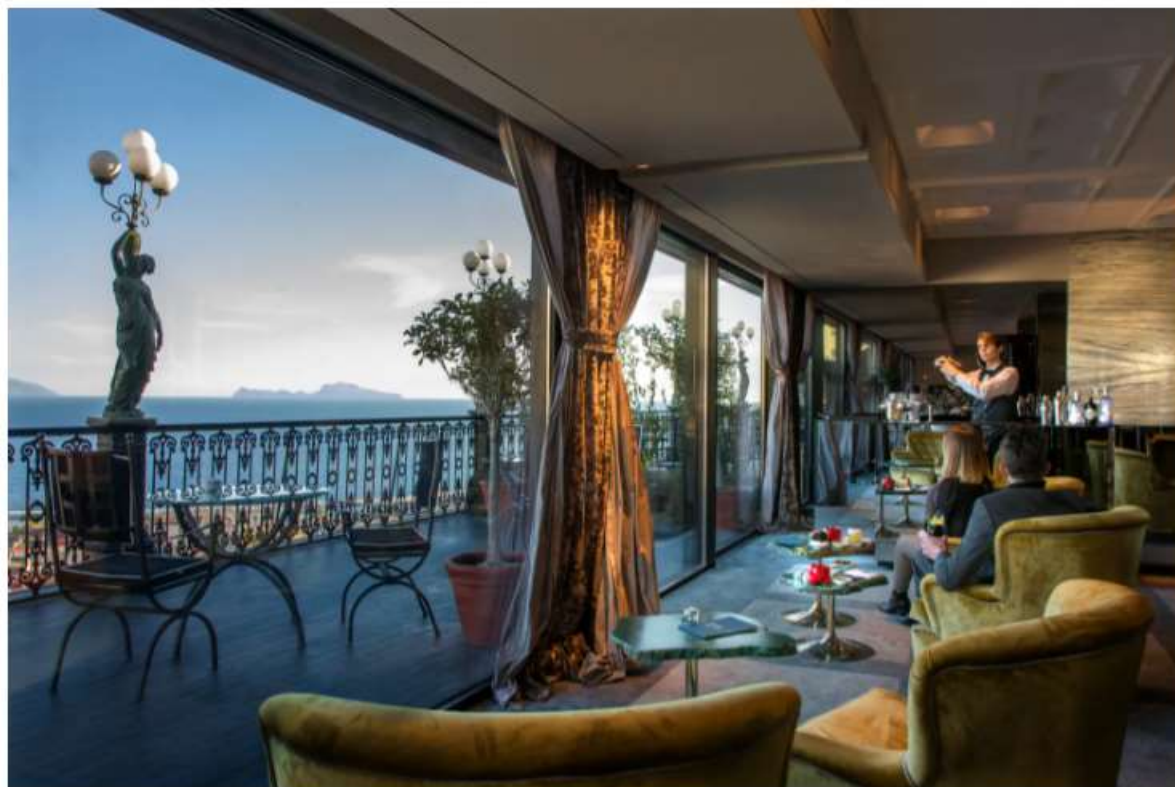
La strepitosa vista sul Golfo di Napoli dalla Terrazza Efeso del Grand Hotel Parker's

Sulla terrazza del sesto piano del Grand Hotel Parker's , storico cinque stelle lusso nel quartiere di Chiaia, con vista impareggiabile sul Golfo di Napoli, ci si ferma per un aperitivo al Bidder Bar ispirato a James Bond e ai suoi cocktail iconici. Non solo, ancora più in alto, al settimo piano, è un must la Terrazza Efeso che ospita il pop up con l' Antiquario , il primo cocktail bar in stile speakeasy di Napoli nonché il locale partenopeo inserito nella prestigiosa classifica dei The World's 50 Best Bars , dove ogni cocktail ha una sua immagine.