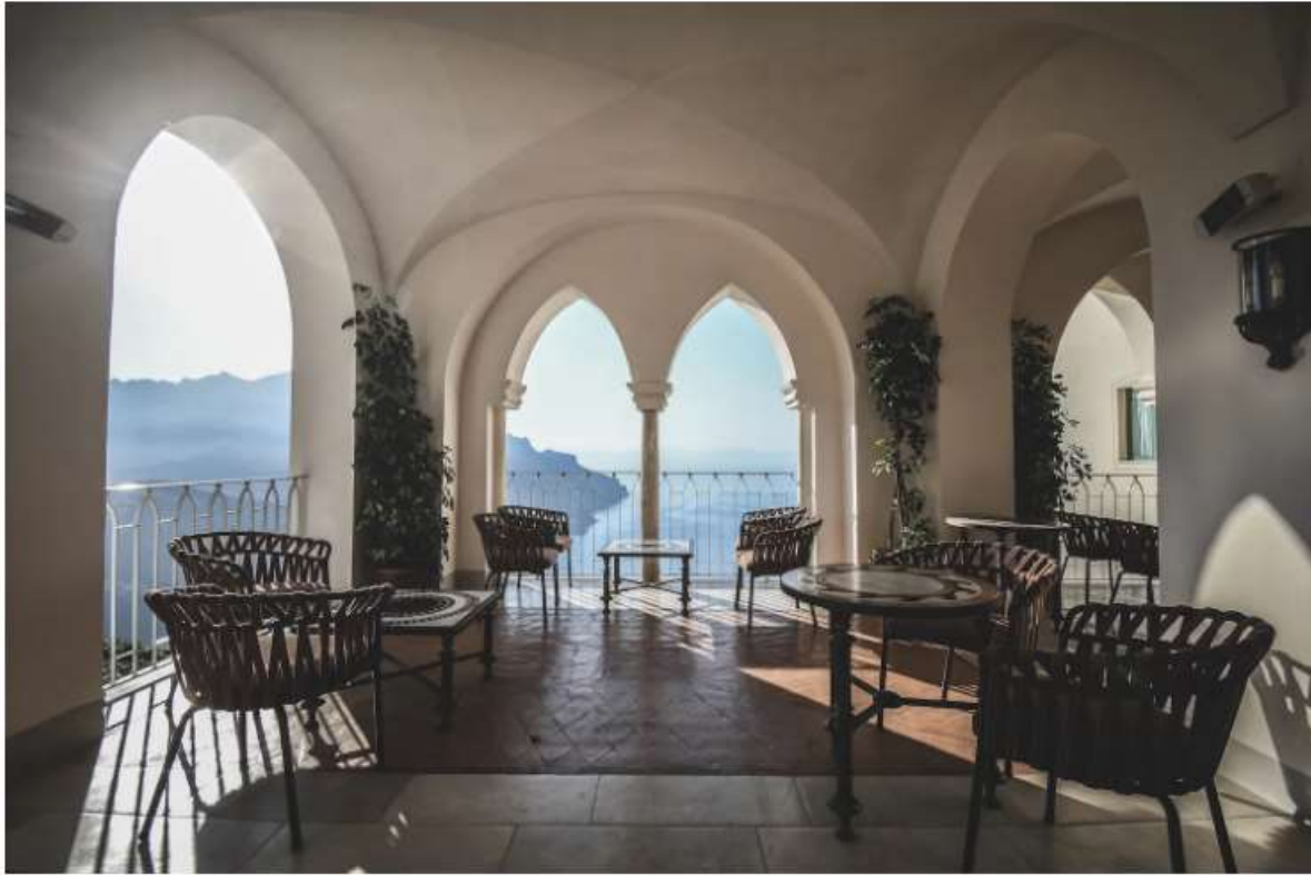
Una delle terrazze del Caruso, A Belmond Hotel, di Ravello