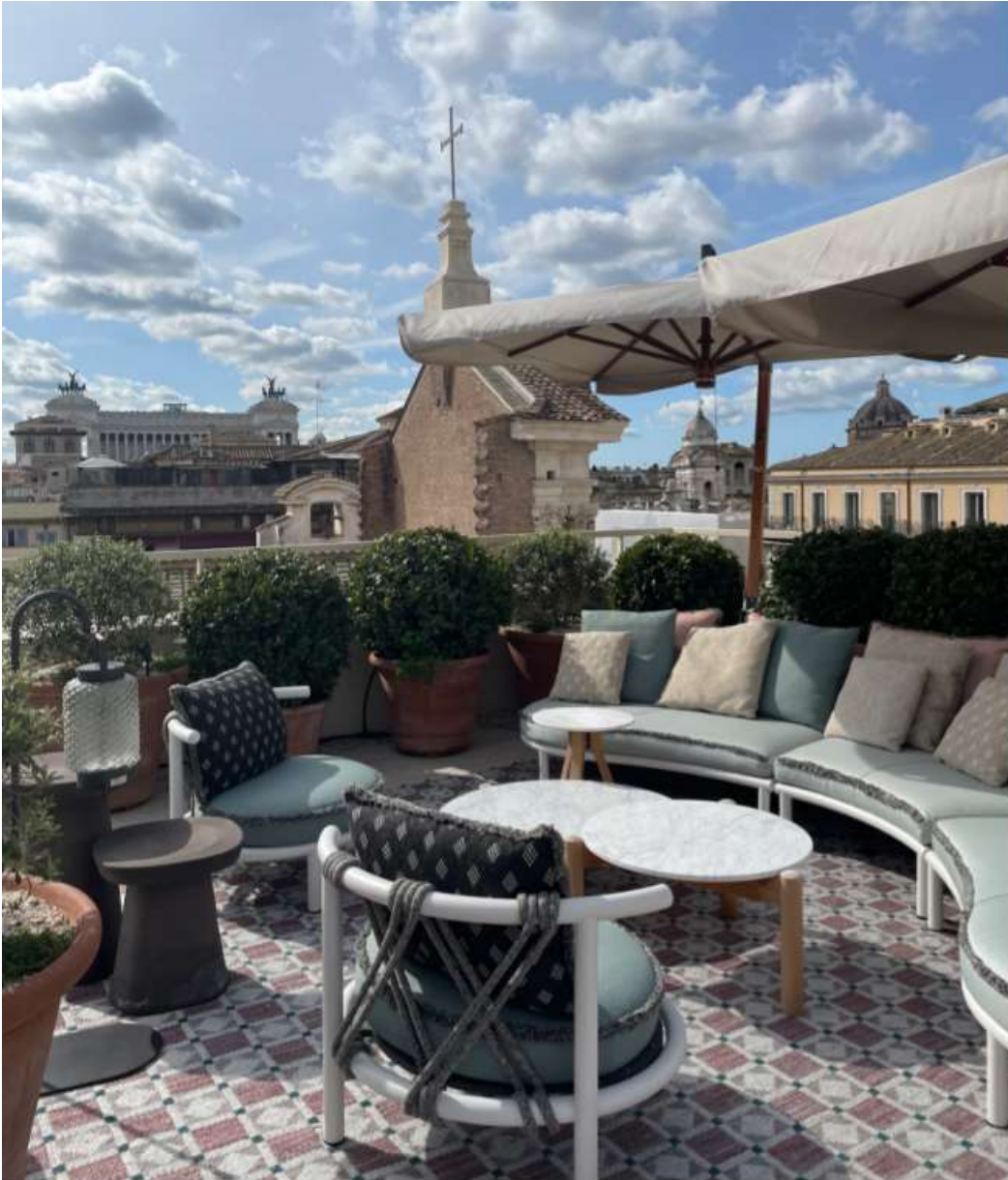
Uno scorcio del NOTOS Rooftop del nuovo Six Senses Rome , primo urban hotel del brand in Italia