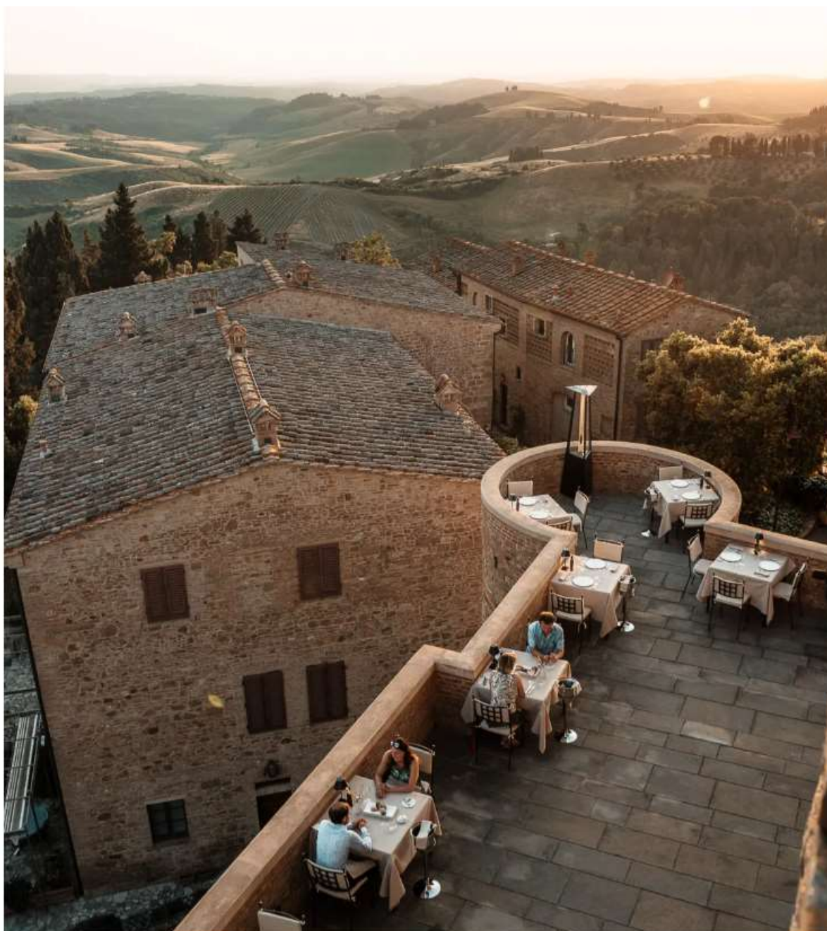
J.K. Lounge Bar, J.K. Place Capri

Per chi agli skyline urbani preferisce godersi la panoramica sulla natura, l'alternativa è la terrazza del Bar Ecrù all'interno del Toscana Resort Castelfalfi , aperta anche agli esterni. Tra Firenze, Pisa e Volterra la vista spazia sulle colline toscane e i 1.100 ettari coperti da boschi, vigneti e uliveti della proprietà, sede dell'albergo diffuso 5 stelle lusso e di una serie di ville e casali. Comodamente seduti ai tavoli e sui divani in terrazza e sul prato antistante, mentre il cielo che si trasforma in una tavolozza di colori, si ordinano bevande calde e fresche, cocktail e liquori di ispirazione toscana accompagnati da finger a base di ingredienti rigorosamente a Km 0 e piccola pasticceria fatta in casa.