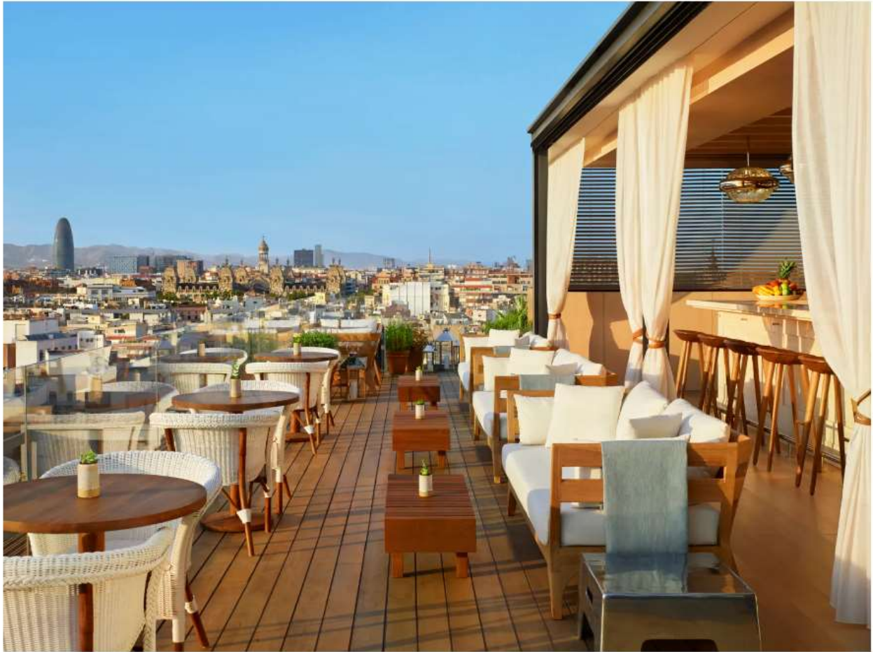
The Roof, al decimo piano del Barcelona EDITION

SUN Deck e WET Pool and Terrace, W Barcelona, Spagna